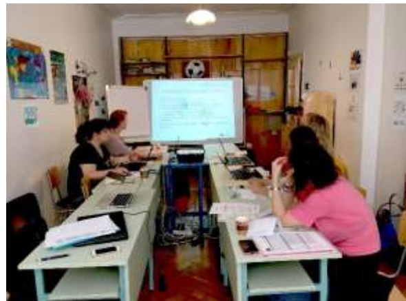
2. Projekt Partner Meeting in Sofia, Juni 2017

Nachdem in den letzten Monaten intensiv nach informellen Skills recherchiert wurde, stand auf der Hauptagenda des Meetings die Auswertung der Rechercheergebnisse, die Selektierung von transversalen Skills und Definierung der Branchen, die Vorbereitung der Fragebögen für innerhalb und außerhalb des Tourismus sowie die Vorbereitung des ersten Management Activity Reports. Darüber hinaus wurden zukünftige Schritte und